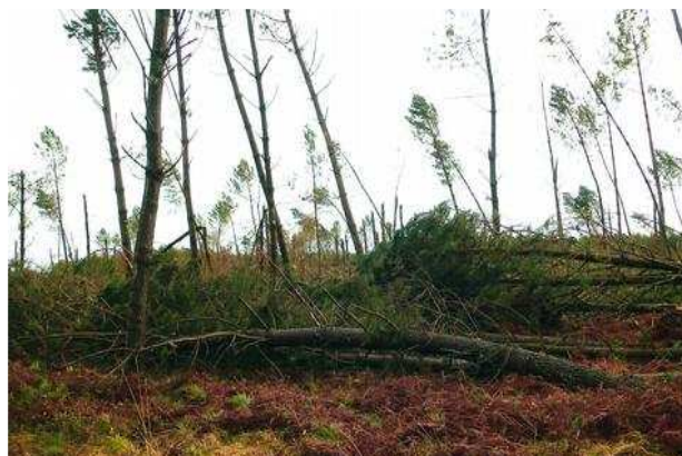
Les pins maritimes ont été couchés ou cassés par la tempête

Dans les mois à venir leur tâche va être immense au regard des dégâts causés par Klaus.